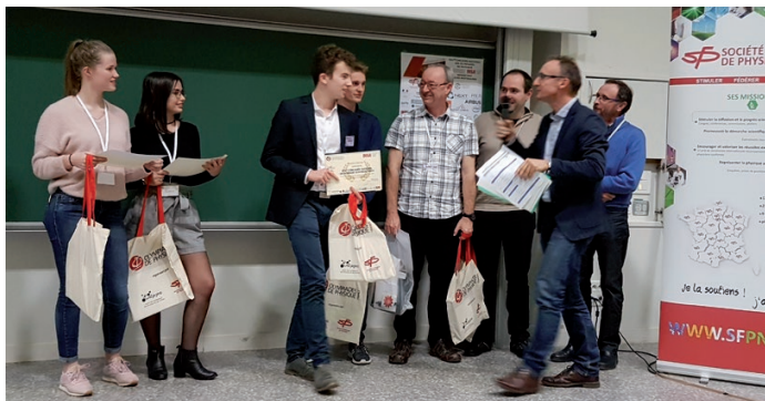
3. Le temps de la récompense pour l'équipe du lycée Branly.