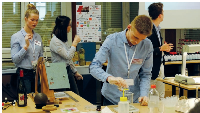
1. L'équipe de « l'opération Marguerite » en plein travail.

On rappelle que le jury favorise l'originalité et la rigueur de la démarche de recherche, le soin accordé aux réalisations expérimentales et à leur exploitation, la qualité de la présentation et des démonstrations effectuées, et l'implication de l'ensemble de l'équipe.