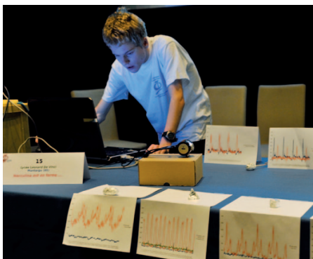
③ Luminosité en fonction du temps pour divers modèles d'astéroïdes – Olympiades de Physique 2011.

Le fonctionnement des Olympiades est assuré grâce aux partenaires financiers : ministère de l'Éducation nationale, de la Jeunesse et de la Vie associative, ministère de la Recherche, CEA, C.Génial, CNRS, Fondation de l'École polytechnique, Esso, Fondation d'entreprise EADS, Nanosciences fondation, National Instruments, Triangle de la Physique, Saint-Gobain. Le Comité des Olympiades remercie tous les partenaires et donateurs qui ont contribué au succès de la XVIII e édition du concours. Sa reconnaissance s'adresse aussi à tous les acteurs bénévoles de cette réussite.