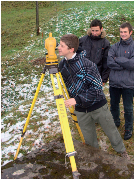
① Mesures avec le tachéomètre.

Les mémoires des groupes sont accessibles à l'adresse : www.odpf.org/antérieures/xviii/les-memoires.php